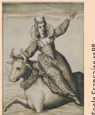
Ecole Française 1588