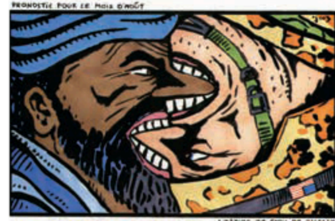
Grote Prijs 2005 - Grand Prix 2005 Cost (Le Journal du Mardi)

Grote stroompanne in de VS, waar in veel staten de doodstraf nog wordt toegepast, meestal op de elektrische stoel. Une panne a privé d'électricité une partie des USA. Dans certains Etats, la peine de mort y est toujours en vigueur par la chaise électrique.