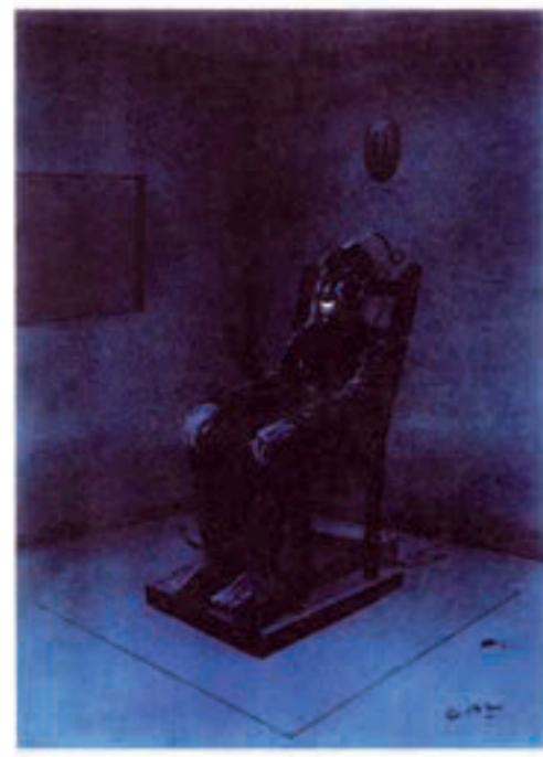
Grote Prijs 2004 - Grand Prix 2004 Gal (Knack)

De Irakese regering die beweert dat ze niets te verbergen heeft, wil nu toch wapeninspecteurs toelaten op haar grondgebied. Saddam Hussein autorise le contrôle des inspecteurs de l'ONU en indiquant qu'il ne possède pas d'armes illicites.