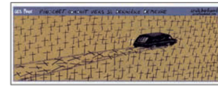
Grote Prijs 2007 - Grand Prix 2007 Cécile Bertrand (La Libre Belgique)

De Olympische Spelen worden toegewezen aan Londen. De dagdaarop wordt de stad getroffen door een reeks moordende bomaanslagen. Les Jeux Olympiques sont attribués à Londres. Le lendemain, la ville est endeuillée par une série d'attentats meurtriers.