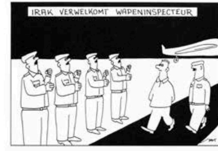
Grote Prijs 2003 - Grand Prix 2003

Ondervraagd over de verboden dopingproducten in zijn besit, beweert wielrenner Frank Vandenbroucke dat ze voor zijn hond bestemd zijn. Interrogé sur la présence à son domicile de produits dopants, le cycliste Fr. Vandenbroucke prétend qu'ils sont destinés à son chien.