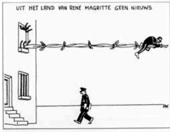
Grote Prijs 1999 - Grand Prix 1999 Zak (De Morgen)

Au pays de Magritte il n'y a rien à voir. Epidémie d'évasions en Belgique. Rien d'étonnant, nous sommes au pays du surréalisme.