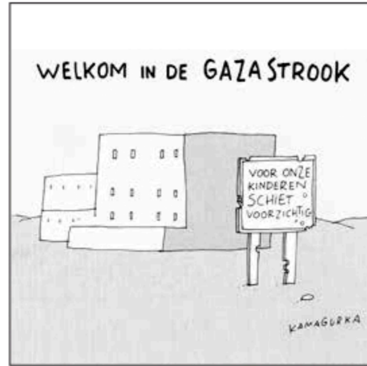
Grote Prijs 2001 - Grand Prix 2001 Kamagurka (De Financieel Economische Tijd)

Au pays de Magritte il n'y a rien à voir. Epidémie d'évasions en Belgique. Rien d'étonnant, nous sommes au pays du surréalisme.