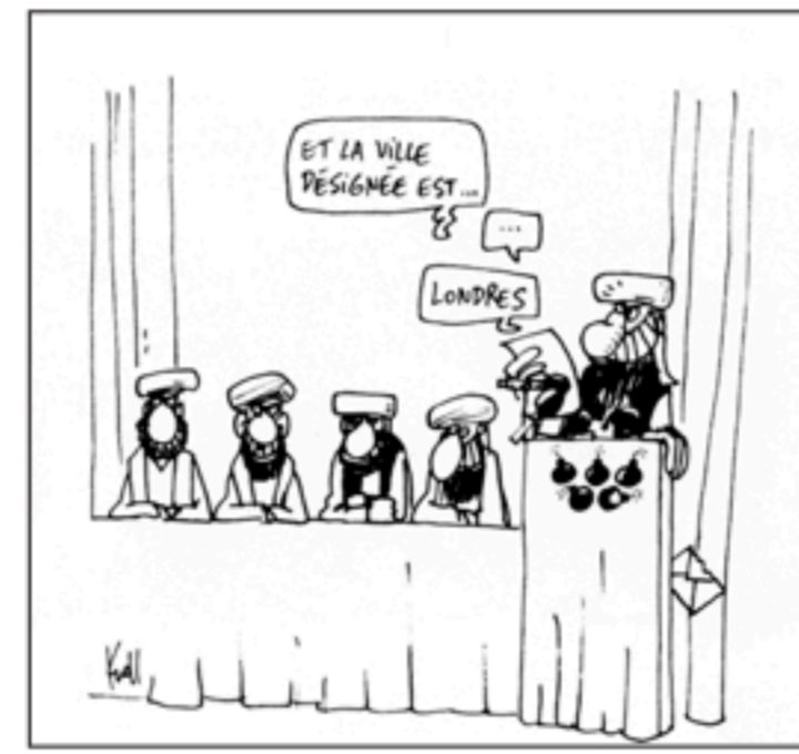
Grote Prijs 2006 - Grand Prix 2006 Kroll (Le Soir)

Eind juli beleeft Irak het bloedigste etmaal sinds de val van het oude regime. En cette fin de juillet, l'Irak connaît les 24 heures les plus sanglantes depuis la chute de Saddam Hussein.