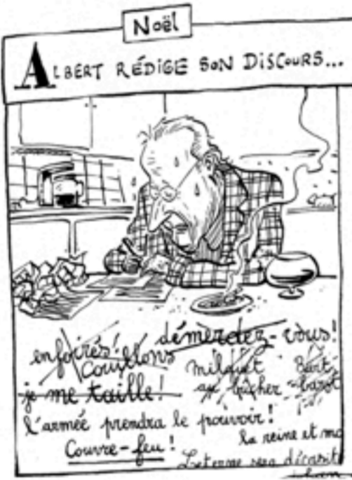
Grote Prijs 2008 - Grand Prix 2008 Johan (Pan)

Op 91-jarige leeftijd overlijdt Pinochet. Zijn tegenstanders noemden hem de Engel des Dood. Décès à 91 ans de l'ex dictateur-Pinochet. Ses adversaires le surnommaient l'Ange de la Mort.