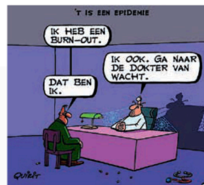
Grote Prijs 2014 - Grand Prix 2014