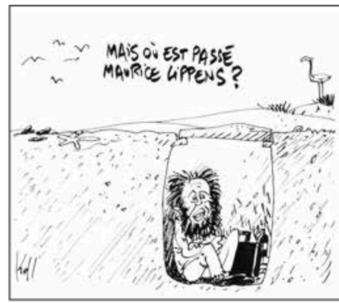
Grote Prijs 2009 - Grand Prix 2009 Kroll (Le Soir)

Kerstmis. De Koning schrijft zijn eindejaaroespraak... Stoomkoppelen! - klotzakken - Doe het dan zelf! - Milquet op de brandstapel - Bart barst - Dan maar zonder mij! - Alle macht aan het leger! - Avondklok! - De koning en ik - Letermie moet hangen