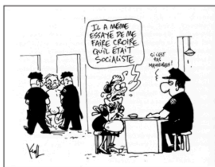
Grote Prijs 2012 - Grand Prix 2012 Kroll (Le Soir)

Almaar meer vrouwen beweren dat ze seks hebben gehad met Tiger Woods, de wereldkampioen golf. De plus en plus de femmes prétendent avoir eu des relations sexuelles avec Tiger Woods, le champion du monde de golf.