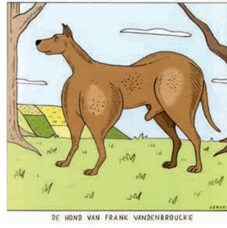
Grote Prijs 2002 - Grand Prix 2002 Jeroom (Humo)

Bienvenue dans la bande de Gaza. Pour nos enfants, tirez prudemment.